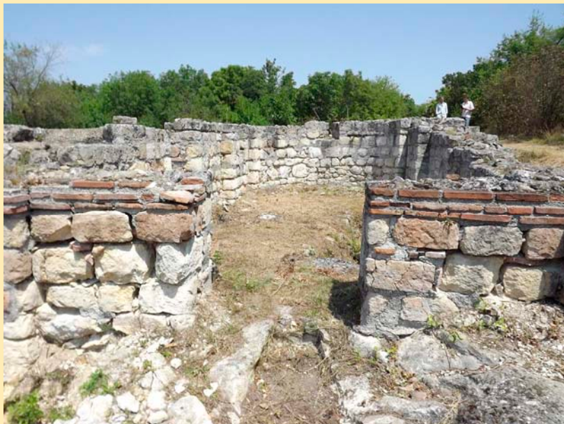
Църква #11, епископски комплекс от 15 век. Комплексът се консервира със средства по Програма за опазване на археологически обекти, консервация и музейно развитие (SPCME), спечелени през 2011 г. Средновековен град Червен, обект на РИМ-Русе.