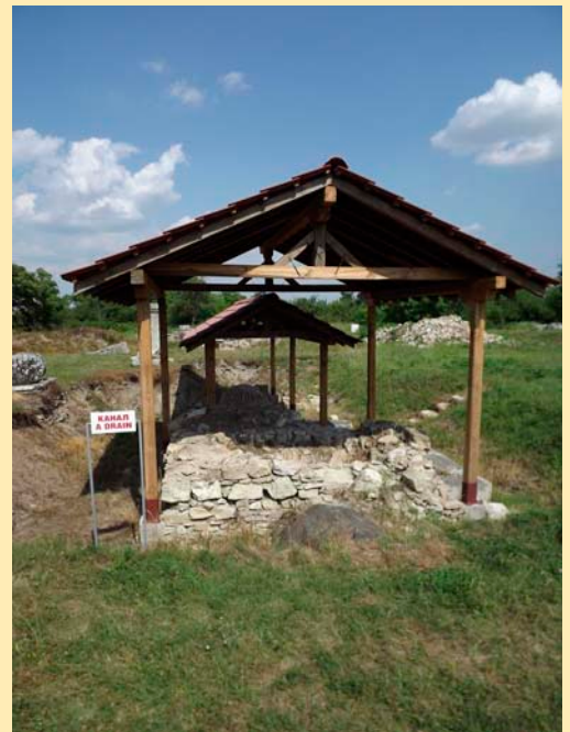
Покривна конструкция над античен канал, монтирана със средствата по Програмата за опазване на археологически обекти, консервация и музейно развитие (SPCME).